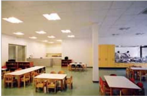
Réfectoire et cuisine au rez-inférieur