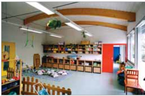
Espace enfant conçu en enfilade...