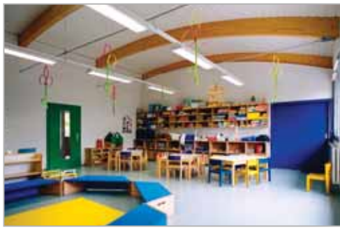
...avec portes de couleur et toiture arrondie