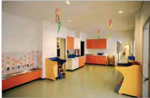
Espace de service et accès aux sanitaires

ont permis d'organiser les salles de vie des enfants (petits, moyens et bébés), vers la façade vitrée orientée au Sud-Ouest. Ces locaux bénéficient de la lumière naturelle et de la relation privilégiée avec le jardin.